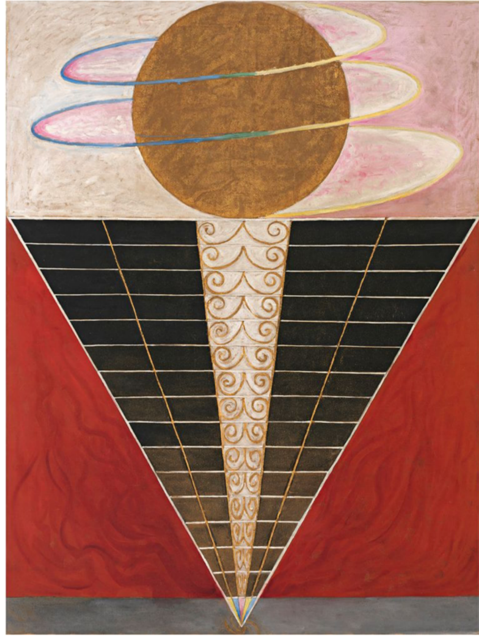
Hilma af Klint, Groep X, No. 2, Altaarstuk (1915). Jit de collectie van Stijfelsen Hilma af Klints Werk.

In deze wonderbaarlijke compositie, een soort draaikolk van krioelende lijnen, stellen de poppetjes 'keeners' voor. Keeners waren de oudere vrouwen die rituele klaagzangen opvoerden. Hun gezang zou de ziel van de overledene helpen om het lichaam te verlaten. In Talbots schilderij wenen deze figuren ook voor ons, suggereert een van de teksten op het doek: 'Een oproep aan de levenden om beter voor zichzelf, de wereld en elkaar te zorgen.' Het verhaal dat in al die kronkelende lijnen en poëtische teksten wordt verteld is niet eenduidig te bevatten, we zien een landschap waarin alles vloeibaar is en in elkaar overloopt.