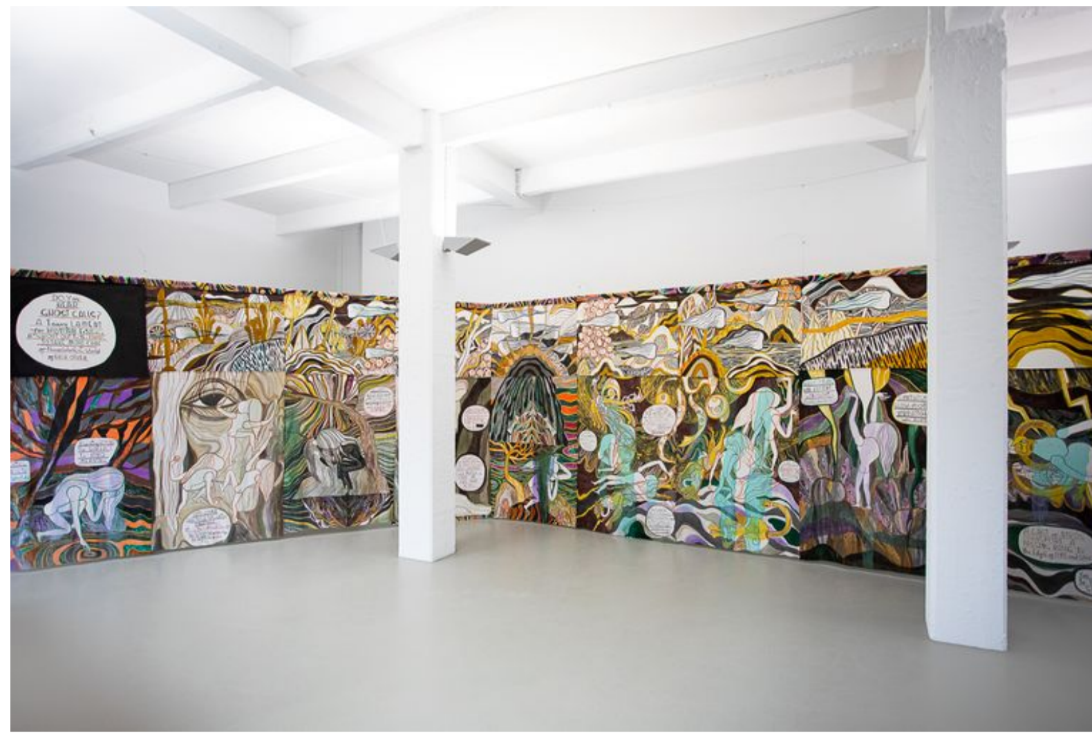
Ghost Calls (2020) van Emma Talbot in galerie Onrust in Amsterdam.

Anna van Leeuwen 17 februari 2022, 12:53