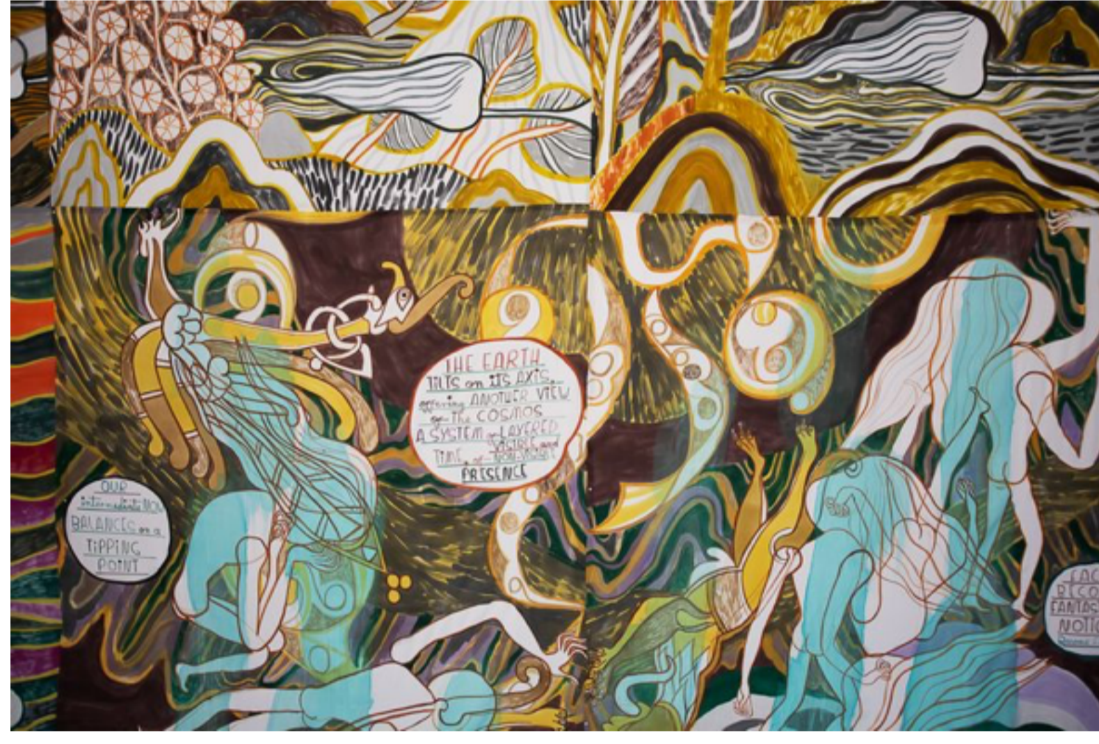
Detail uit Ghost Calls .

Talbots gewoonte om zich in haar kunst binnenstebuiten te keren en de eigenzinnige visuele taal die ze daarbij vond, doen me denken aan de Zweedse schilder Hilma af Klint (1862-1944). Zij maakte, als een van de eerste kunstenaars, grote abstracte schilderijen. Geregeld waren de geometrische vormen en kleuren die ze schilderde haar ingegeven door 'geesten' in seances.