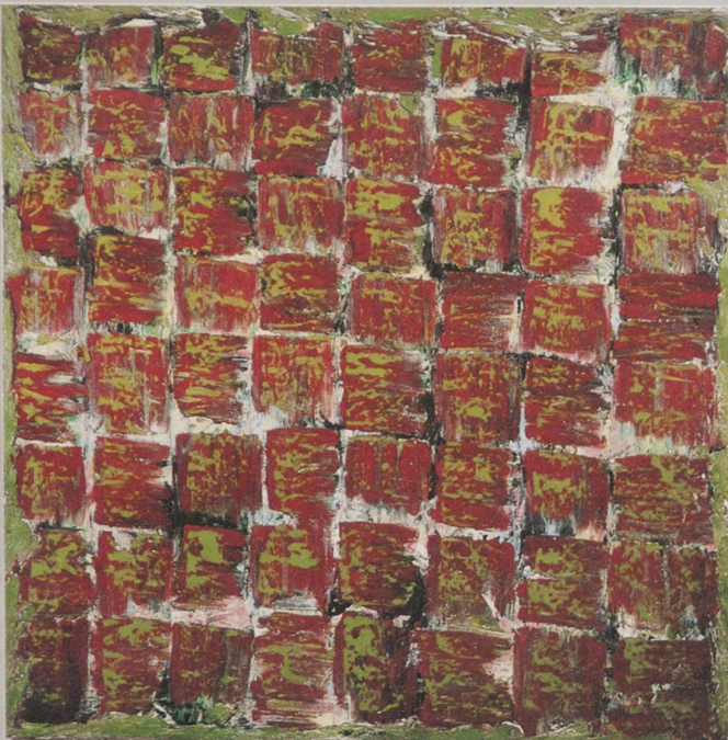
Links: 1986, olieverfdoek, 160x160 cm Rechts: 1987, olieverfdoek, 120x120 cm Onder: 1986, olieverfdoek, Grieks kruis