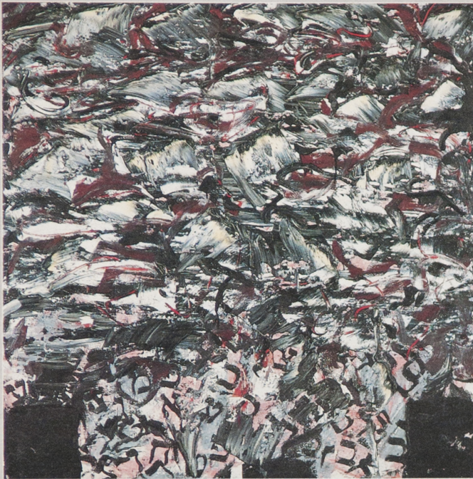
Links: 1987, olieverf/doek, 120x120 cm Rechts: 1985, olieverf/doek, 160x160 cm Onder: Vier tekeningen, 1987, gemengde techniek 50x50 cm