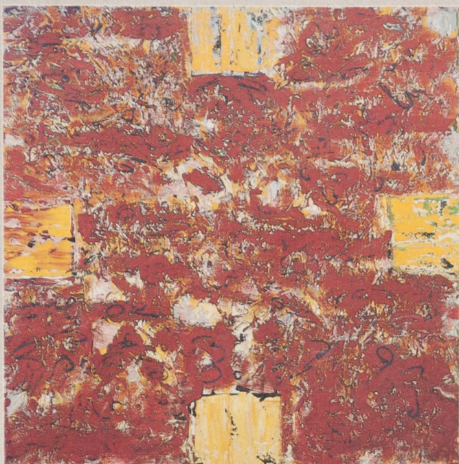
Links: 1987, olieverf/wasverf/doek, 120x120 cm Rechts: 1987, acrylverf/paneel, 49x49 cm Onder: 1987, wasverf/acrylverf/paneel 49x49 cm