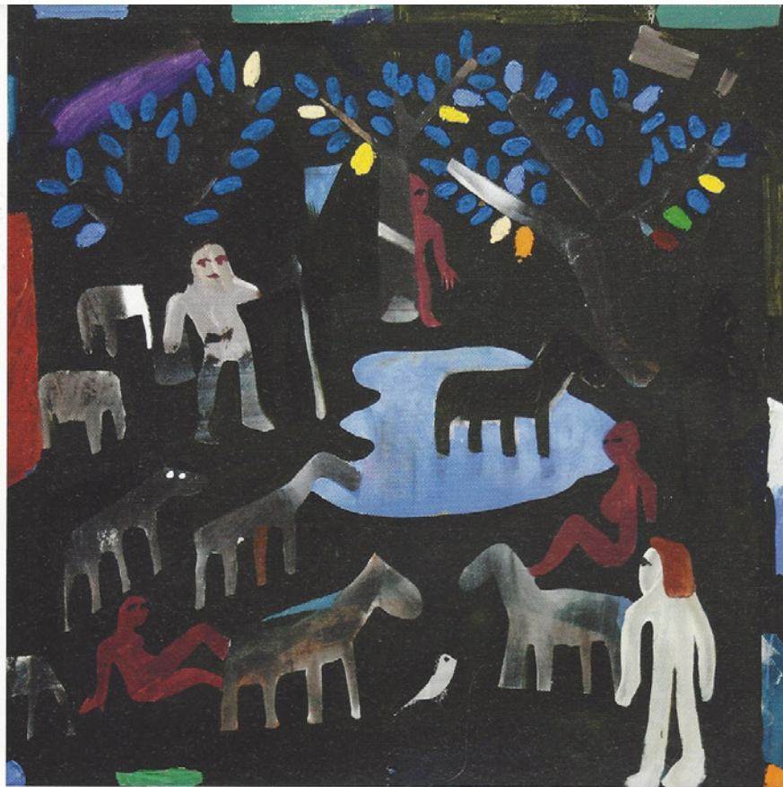
← Derk Thijs, Bucolisch , 2007, olieverf op doek